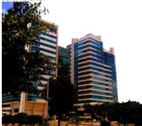
B2C GLOBAL: Cra 9 113-52 Oficina 1901 Bogota

Somos una empresa Colombiana creada el 23 de Febrero de 2004, con matricula 01346029 de la Cámara de Comercio de Bogotá - Colombia, NIT 830135759-2 bajo el Régimen Común del Sistema tributario Colombiano.